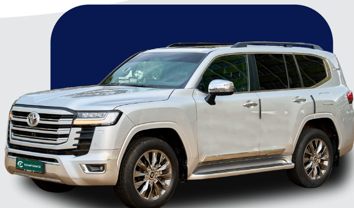
普拉多 VX ( 2023, 2022, 2021)