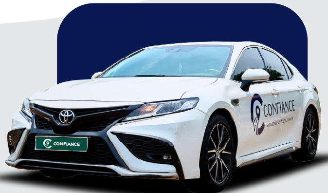
丰田卡罗拉 (2022, 2023, 2025)