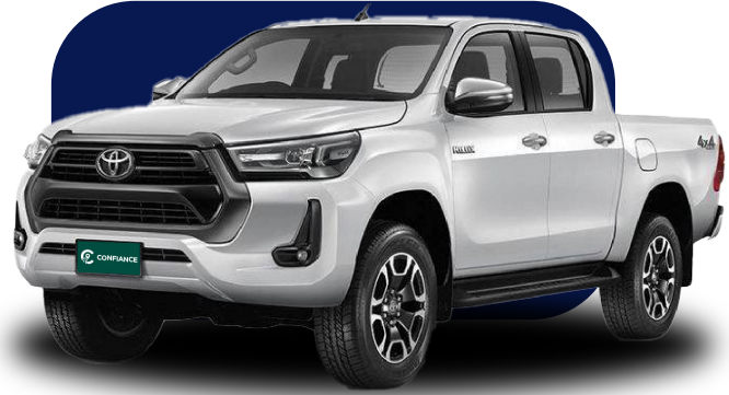
丰田皮卡 (双排) (2022, 2023, 2025)